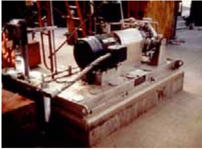
Imagen 1. Grouting de base de motores

ADICRET GROUT Mortero para anclaje de pernos y nivelación de placas