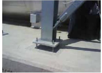
Imagen 2. Grouting a nivel